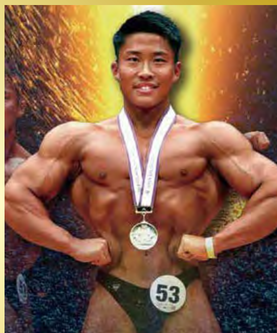
日本ボディビル選手権3連覇