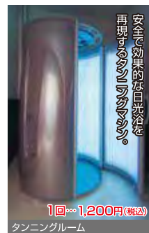
タンニングルーム