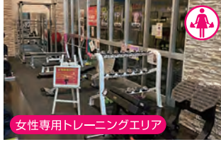
女性専用トレーニングエリア