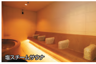
塩スチームサウナ