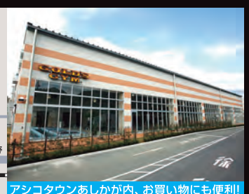
アシコタウンあしかが内、お買い物にも便利!